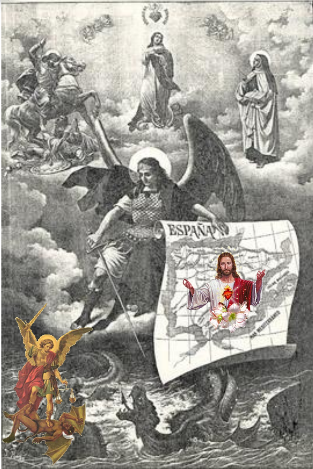
SANTO ÁNGEL CUSTODIO DE ESPAÑA - MARIANO